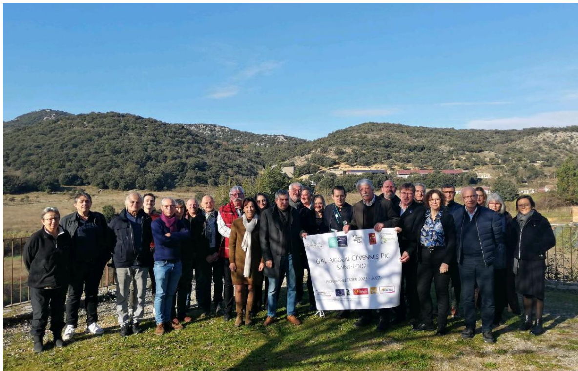
Comité de Programmation du GAL lors de la réunion d'installation le 18 décembre 2024 à Montoulieu